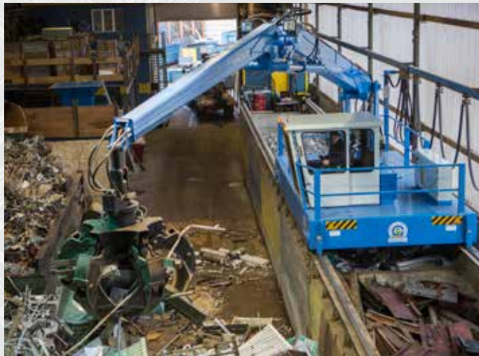
Schnyder Transportunternehmung und Altmetalle, Tann, Suisse