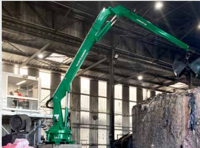
SARPI VEOLIA, La Talaudiere, France