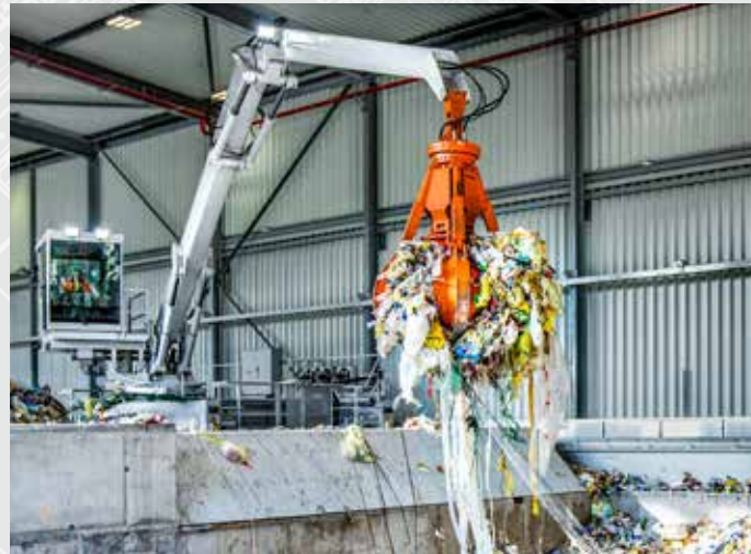
SUEZ Recycling Süd, Ölbronn, Allemagne